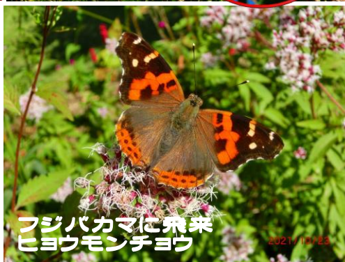
フジバカマに飛来 ヒヨウモンテョウ