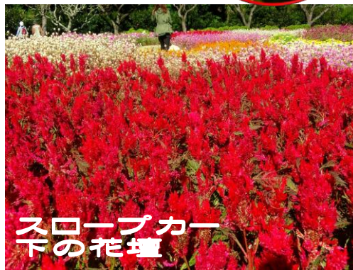
スロープカー 下の花壇