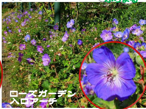
ローズガーデン 入ロアーチ