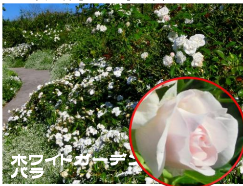
ホワイトガーデン バラ