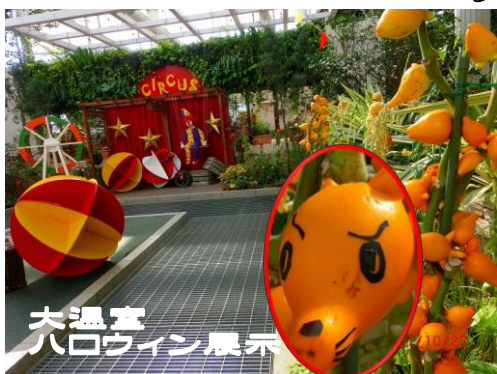
大温室 ハロウィン展示