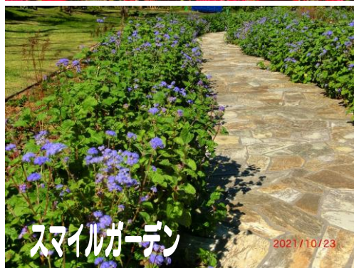
スマイルガーデン