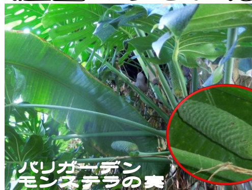
バリガーデン モンステラの実