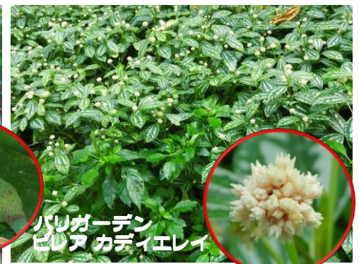
バリガーデン ピレア カディエレイ