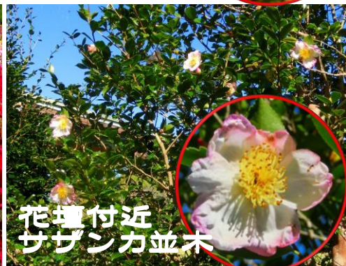
花壇付近 サザンカ並木