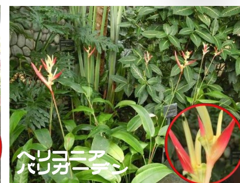
ヘリコニア バリガーデン