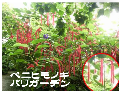
ベニヒモノキ バリガーデン