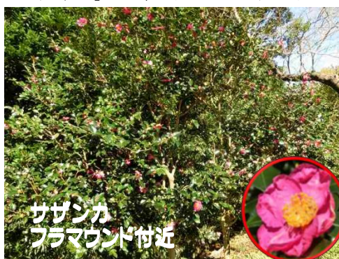
サザンカ フラマウンド付近