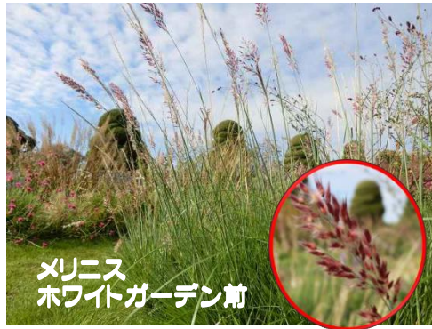
メリニス ホワイトガーデン前