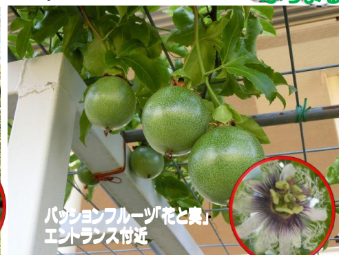
パッションフルーツ「花と真」 エントランス付近