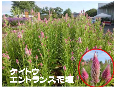
ケイトウ エントランス花壇