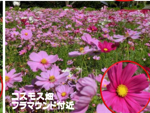
コスモス畑 フラマウンド付近