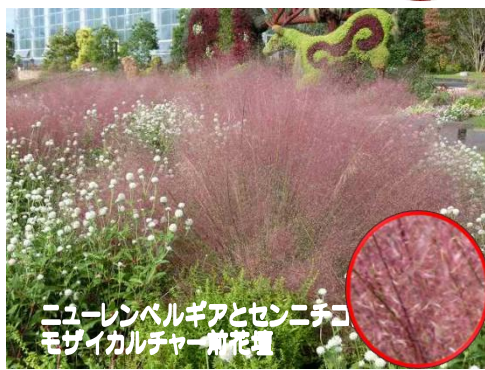
ニューレンベルギアとセンニチコ モザイクカルチャー畑花壇