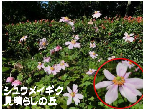
シユウメイギク 見晴らしの丘