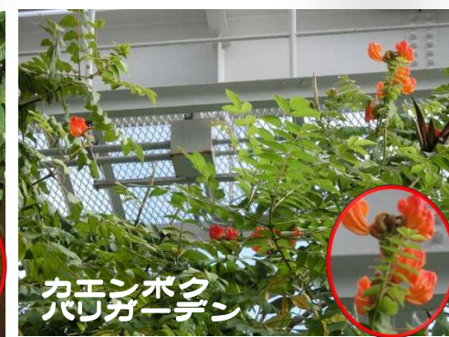
カエンボク バリガーデン