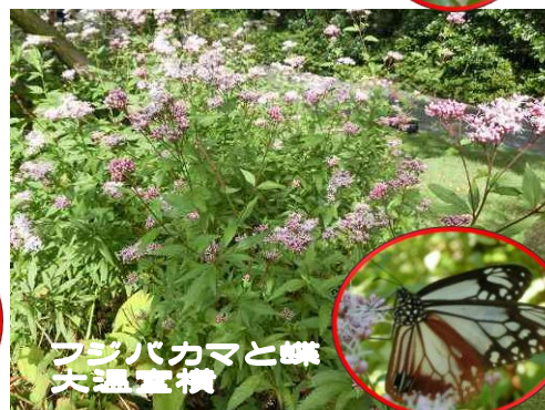
フジバカマと蝶 大温室横