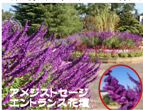
アメジストセージ エントランス花壇