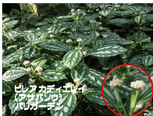
ピレアカディエレイ (アサバソウ) パレオニクス