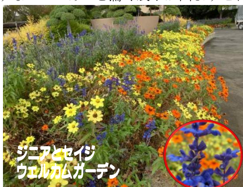
ジニアとセイジ ウェルカムガーデン