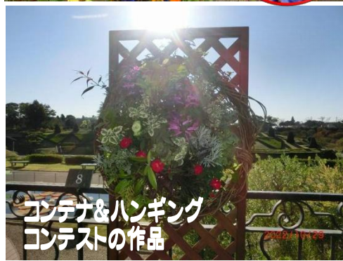
コンテナ&ハンギング コンテストの作品