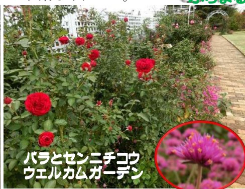
バラとセンニチコウ ウェルカムガーデン