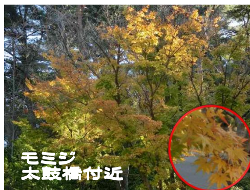
モミジ 太鼓橋付近