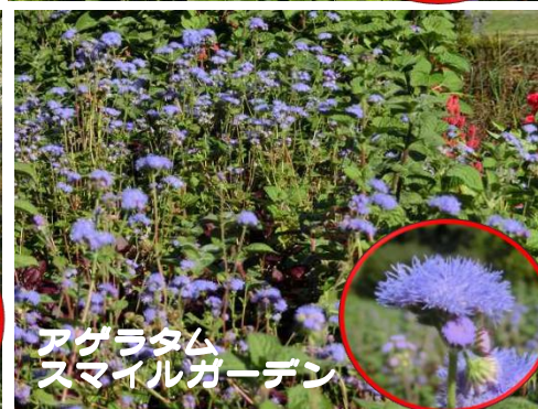
アゲラタム スマイルガーデン