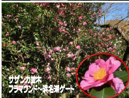
サザンカ並木 フラマウンドへ浜名湖ゲート