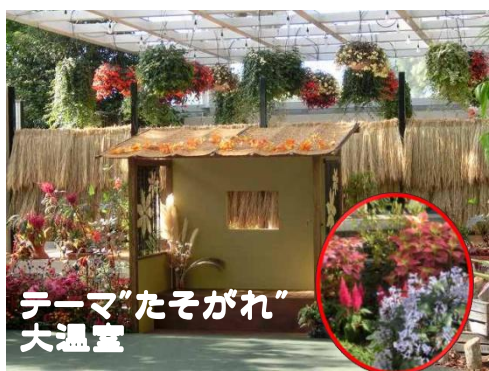
テーマ“たそがれ” 大温室