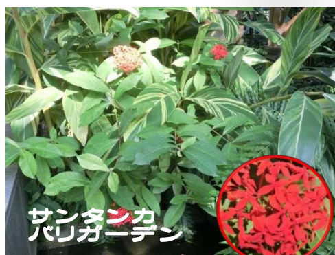
サンタンカン パレオニクス