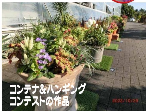
コンテナ&ハンギング コンテストの作品