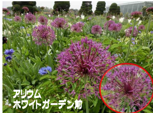
アリウム ホワイトガーデン前