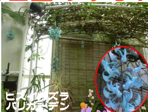
ヒスイハスラ バリガーデン