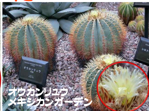
オウカンリュウ メキシカンガーデン