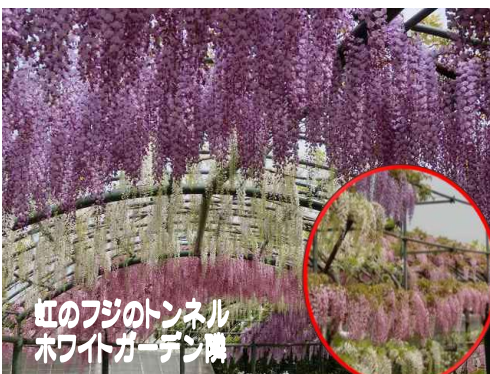
紅のフジのトンネル ホワイトガーデン前