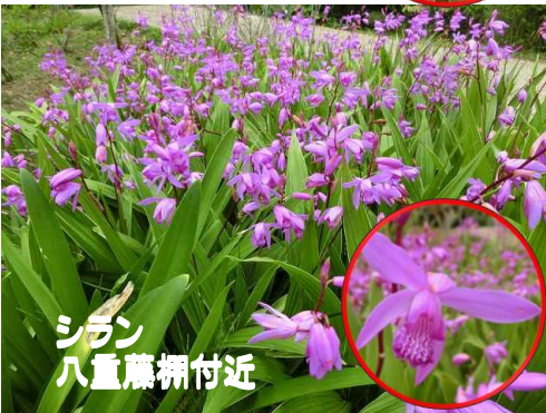
シラン 八重藤棚付近