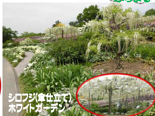
シロフジ(傘仕立て) ホワイトガーデン