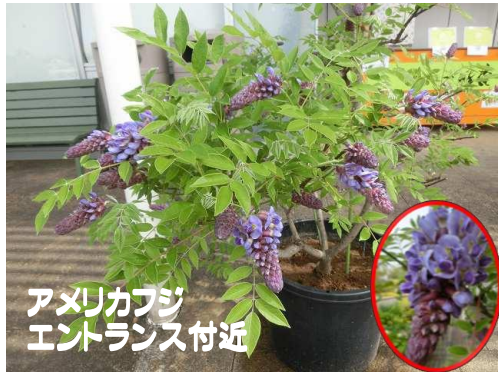
アメリカフジ エントランス付近