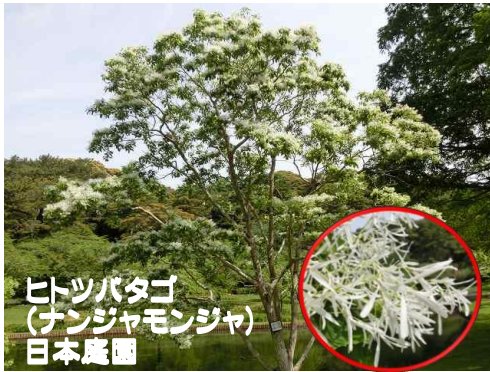
ヒツパタゴ (ナンジャモンジャ) 日本庭園