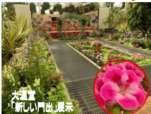
大温室 「新しい門出」展示