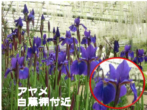
アヤメ 白藤棚付近