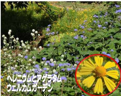
ヘレニウムとアグラタム ウェルカムガーデン