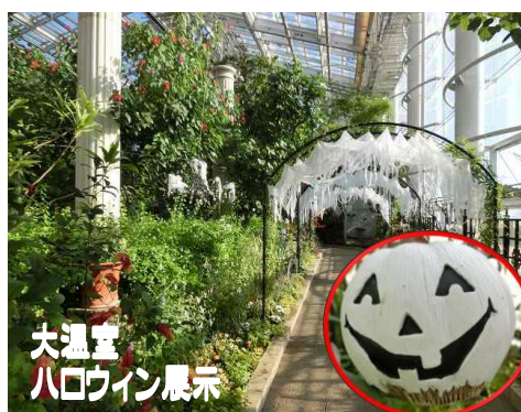
大温室 ハロウィン展示