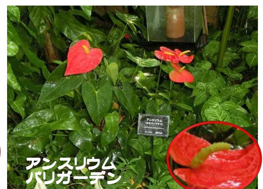
アンズリウム バリガーデン