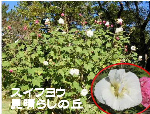
スイフヨウ 見晴らしの丘