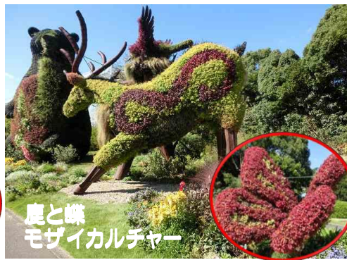
鹿と蝶 モザイカルチャー