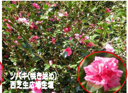
ツバキ(咲き始め) 西芝生広場生壇