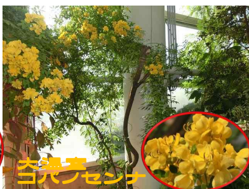
大温室 コバノセンナ