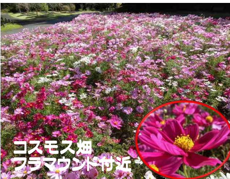
コスモス畑 フラマウンテン付近