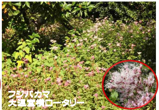
フジバカマ 大温室横ロータリー