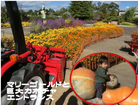
マリーゴールドと 巨大カボチャ エントランス

バラ園を始め、エントランスや各所のバラが香り、綺麗に咲き見頃になりましたぞ〜。エントランスは秋深し収穫の秋??ならぬ見頃の秋!!トラクターの後ろにはアメジストセージやマリーゴールドが所狭しと「咲いて」いますよ〜。大温室はハロウィンだね!!今年は多くの仮装した子供達で大賑わいです、メキシカンガーデンも忘れず見てくださ〜い。