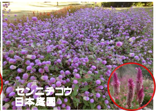
センニチコウ 日本庭園