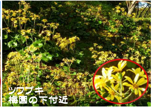
ツツジ 梅園の下付近