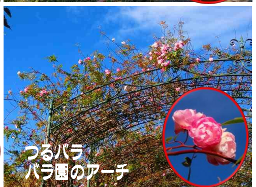
つるバラ バラ園のアーチ