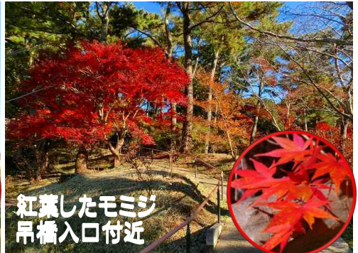
紅葉したモミジ 吊橋入口付近