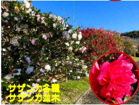
サザンカ各種 サザンカ並木