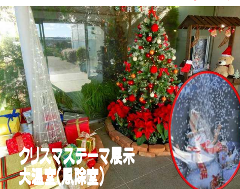
クリスマステーマ展示 大温室(風除室)