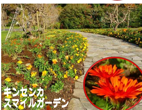
キンセンカ スマイルガーデン