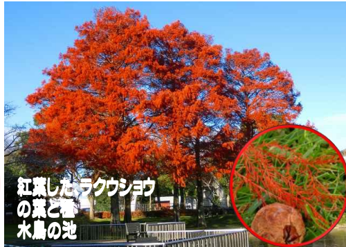
紅葉したラクウショウ の葉と 水鳥の池