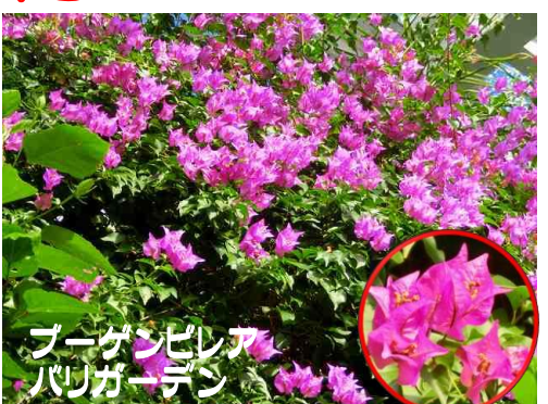
ブーゲンビリア バリガーデン