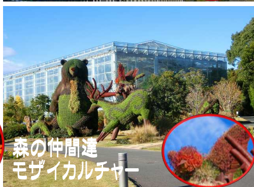
森の仲間達 モザイカルチャー