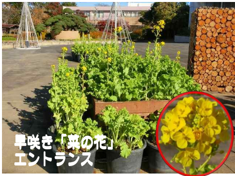
早咲き「菜の花」 エントランス