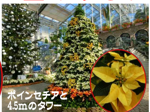
ポインセチアと 4.5mのタワー