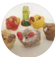
木目込みの干支(亥)